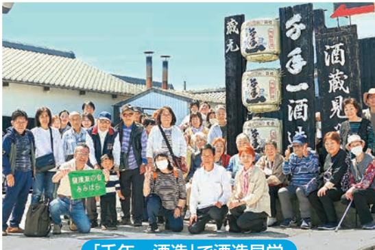
「千年一酒造」で酒造見学