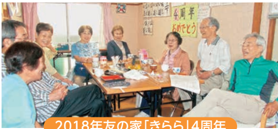
2018年友の家「きらら」4周年

13年間にわたり高石ブロック唯一の友の家として親しまれてきた「きらら」が、2026年6月をもって閉鎖することになりました。旧高石診療所が「高石みもとセンター」として新設され、わずか100mの距離で活動内容が重なるため、競合は避けられないと判断したためです。私が友の会に参加し北支部長となった時期に開設された「きらら」は、中央支部の単独運営が難しいとの理由から共同で