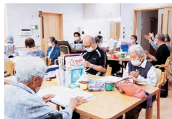
歌って健康づくり

無理なく体を動かしながら、日常生活をより安全に元気に過ごせるよう、これからも、利用者へ寄り添いながら、心身の健康づくりを支援してまいります。