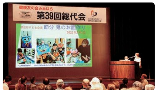
子ども企画の取り組みについて(上野芝向ヶ丘支部)