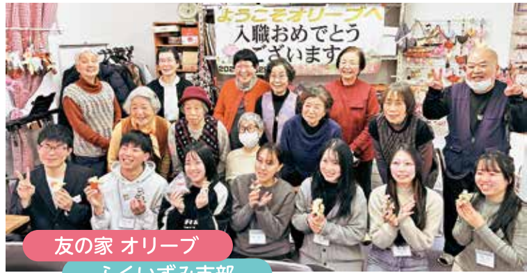
友の家 オリーブ ふくいずみ支部