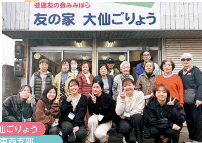
友の家 大仙ごりよう 東西支部

4月2日、新入職員63名が10グループに分かれて「友の家」を訪問し、体験・懇談を行いました。 各支部、絵手紙や書道、小物づくり、大仙公園でのお花見など、さまざまな体験を準備して明るく迎え入れてくださいました。 今回の交流を通じて、新入職員からは「会員さんからの応援を受けてこれから頑張っていきたい」、「友の家はとても居心地の良い場所でもた訪れたい」など感想が寄せられました。