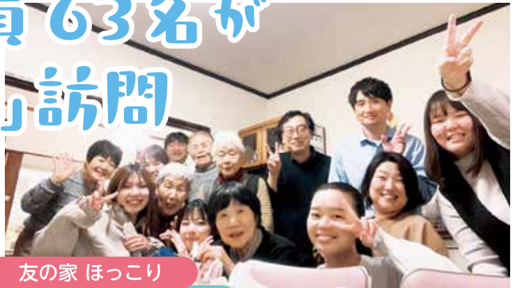
友の家 ほっこり 上野芝向ヶ丘支部