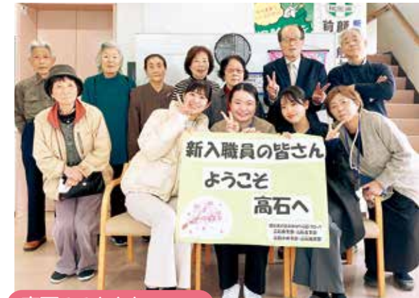
高石みみともセンター 高石ブロック