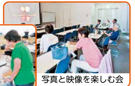
写真と映像を楽しむ会