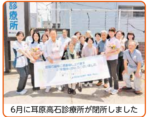
6月に耳原高石診療所が閉所しました