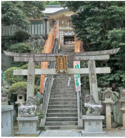
「延喜式」(927年)にも名を連ねる美多彌神社(鴨谷台)