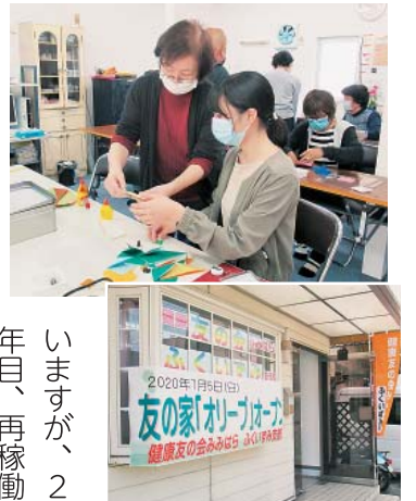
いままが、2 年目、再稼働

に向けているいろいろな企画も考えています。健康マージャンの再開、ウォーキング、おしゃべり会、健康吹き矢。我々のささやかな楽しみさえも奪ってしまおうコロナウィルスの脅威と、後手後に回ってしまおう行政の対応に腹立ちといら立ちを覚えながら、緊急事態宣言解除を待っています。昨年来の「お元氣ですか」電話訪問を続けながら、会員さんとのつながりも深めていきたいと思っています。