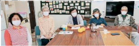
最近の世話人会(みんな、マスク)