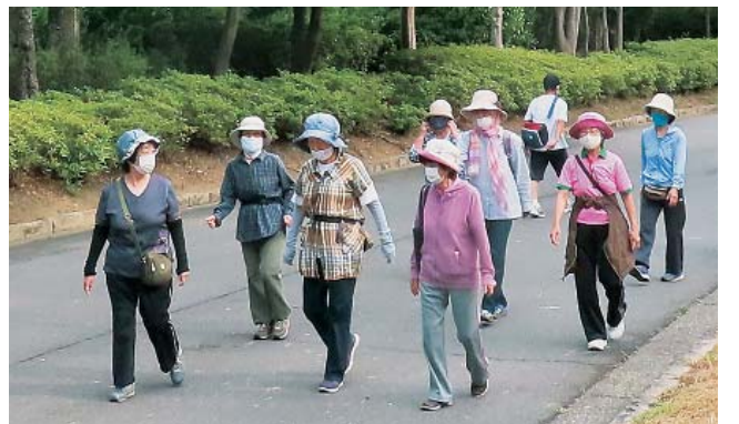
早朝に仲間とウォーキング

3月からはじまった「第15回健康づくりチャレンジ」(3月~5月)は、昨年を少し上回る1367人のエントリーがあり、1125人から結果報告が提出されました(達成率81%)。コロナ禍のなかのチャレンジとなり、エントリーによっては困難な状況の方もおられたと思います。