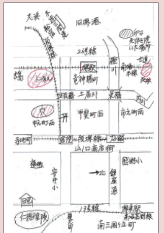
山口さん自筆の地図

つけて帰ってきたとき、母の目に涙を見た。今でもおふくろの顔を思い出すと涙が出る。おふくろは強いと思う。昭和20年7月10日の長い夜でした。堺空襲7月10日を忘れない!!