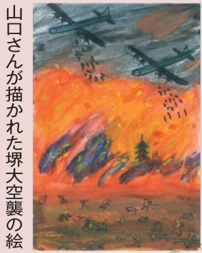
山口さんが描かれた堺大空襲の絵