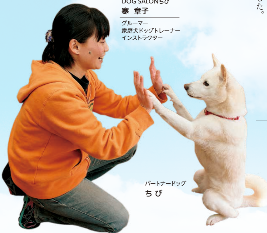
パートナードッグ ちび

私が担当した地域の避難所では、共に生き延びた命だから大切にしようと思われられた動物がいました。また、共同生活をしている方たちの癒しや話題を提供し、交流を取り持つアイドルの存在の動物もいました。一方、慣れない生活で体調を崩し、下痢や嘔吐・皮膚炎などで、嫌な臭いがしている動物がいました。他の人に吠えかかると、あちこちで排泄するため、邪魔者扱いをされている動物もいました。