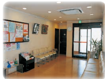
モダンで落ち着いた待合空間。