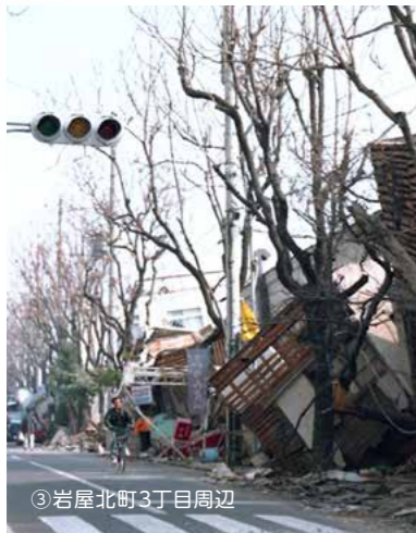
③岩屋北町3丁目周辺

状を見聞きすることができたのです。この経験を通して、犬には日頃から清潔と健康を保つために手入れしてやること、排泄させる場所や処理に心くばりすることなどが本当に大切だと思ひました。また飼い主の指示に従うようにしつづけるとともに、状況を讀む力を身につけさせ、地域の人に認められるようにしておいてやることなども考えておかなければいけないことだと気づきました。緊急時においても、犬との生活を少しでも豊かに維持するためには、飼い主は日常生活での犬との関わり方、地域との関わり方に配慮しておくことの大切さを強く感じた経験でした。