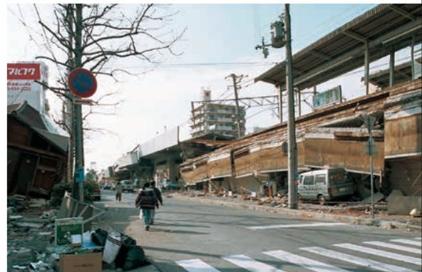
②JR六甲道駅南側東西道路の西を望む

こうした活動をしている中で「被災動物の行動調査ボランティア」に移るよう要望がありました。避難所やテント村を訪問して、地震発生時に動物がどのような行動をし、飼い主とどのように避難してきたか、避難所やテントでどのように暮らしているかなどを聞きとる調査です。