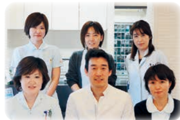
笑顔あふれるスタッフで地域の方々の健康をサポートしています。

最後に一言お願いします みなさんが安心して暮らせる地域にしたいと願っています。「すべてはみんなの笑顔のために」、それがモットーです。