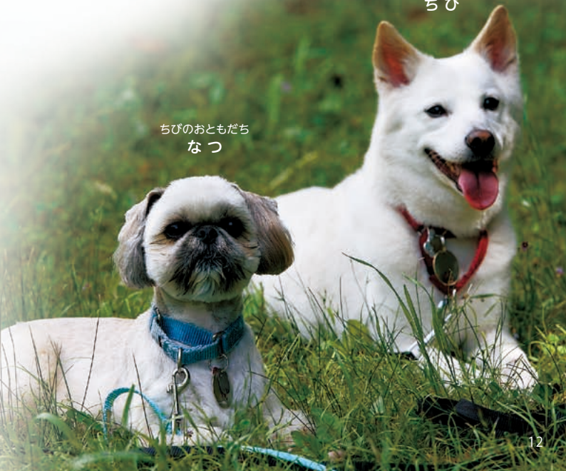
ちびのおともだち なつ

が与えた犬用トイレだけ。他の場所ではしてはいけない。むやみやたらに吠えない。知育玩具やガムなどは咬んでもいいが、人や家具・電気コードなど咬んではいけないものもある。食餌の時は動き回らずに落ち着いて待っている。このようなことがいくつも考えられます。 家の外ではどうでしょう？リード(引き綱)を着けないと、お散歩などの外出はできない。引張って歩かない。あちこちで排泄しない。動物病院やトリミングショップでは、落ち着い