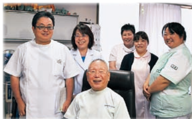
いつも笑顔が溢れるスタッフの皆さん