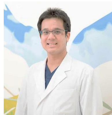
整形外科 部長医師