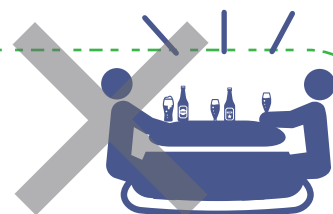
訪問者との食事会