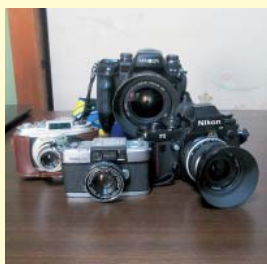
藤村さん愛用のカメラ

高校卒業後は写真屋で約1年務めた後、伸銅会社に就職し、会社内の写真クラブに所属し撮影会を開くなど活動されました。現在は西陶器支部の世話人として活動され、2013年には中区ブロック写真同好会を立ち上げました。当初は4人だった参加者も、現在では約20人が集まり、年に6回撮影会と合評会を開いています。2年前には新金岡支部でも写真同好会の立ち上げに携わり「年金の中で楽しむ」ことを大切にされています。