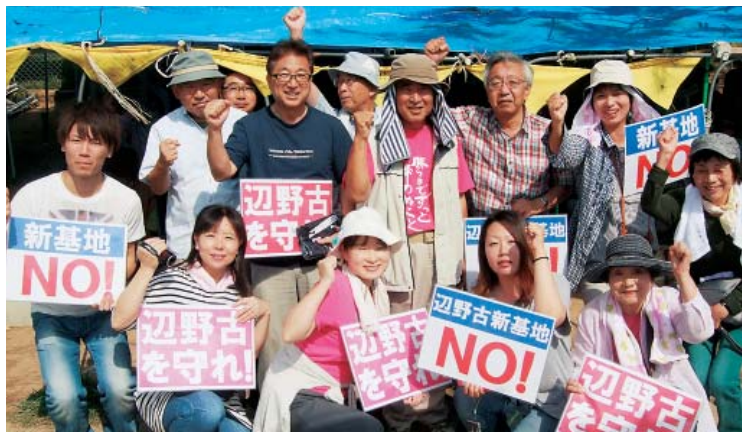
テント前で座り込む南ブロックのみなさん

ケアマネージャーとして社会資源の活用、制度の限界に行き詰まりながらも、多くの関係機関の方々と連携し、ご本人やご家族の思いに寄り添った支援を経験できたことに、感謝します。