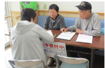
↑ファミリークリニック玄関前での署名活動