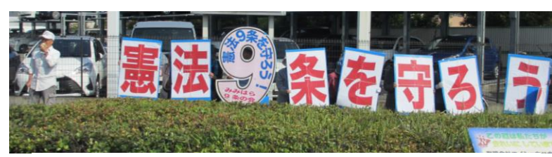
↑9の日宣伝…憲法9条を守ろうの取り組みをしています。9の日に行っています。(4/9中止)

健康友の会みみはらでは、病院や薬局、介護施設などのみみはらグループと連携しながら、健康づくりに取り組んでいます。 また、地域の人たちと一緒に安心して住み続けられるまちづくりにとりにくんでいます。