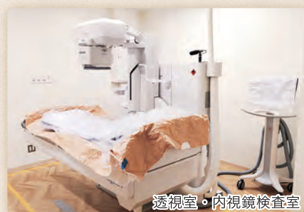
透視室・内視鏡検査室

さらに、当検査室には専門の知識と技術を持つ内視鏡技師が複数名在籍しており、医師と連携しながら、安全で質の高い検査を支えています。検査から治療までを