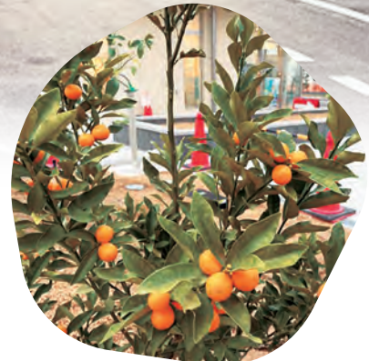
実がなる木を植えました

友の会のみなさんと力を合わせながら、地域に根ざしたクリニックをつくっていきたくと思います。