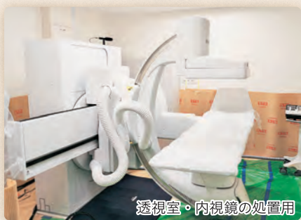
透視室・内視鏡の処置用

このたび耳原総合病院の内視鏡室は、1階から3階へ移転し、6月1日よりオープンします。