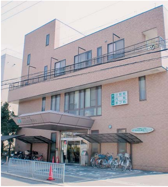
みみはら高砂クリニック