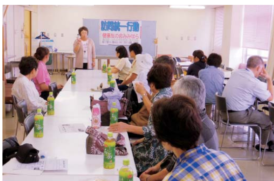
鳳ブロック訪問行動

鳳は弁当、ファミリーはカリーの炊き出しをおいしく頂き、両ブロックとも全戸訪問に取り組みました。入会は鳳支部の1世帯だけでしたが、合わせて300軒を訪問し、戦争反対署名や健診のお勧めなどを訴えました。