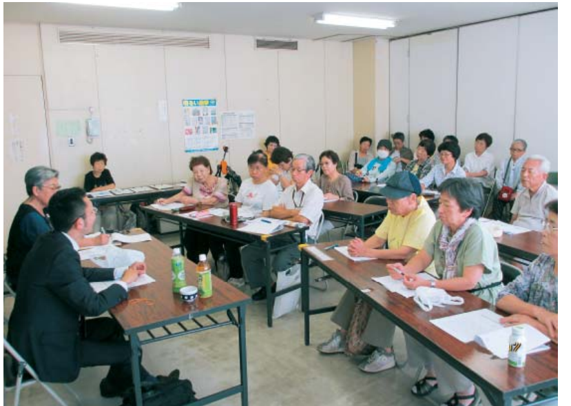
予想を超える数の参加者