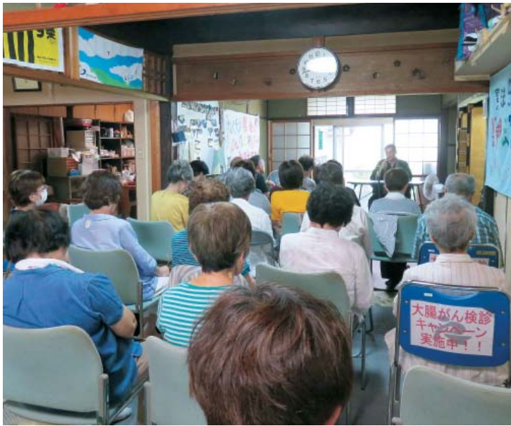
僧侶の話を聞く参加者

人は死んだらどうなるのか! 仏様とは誰なのか! 7月28日、泰山山西栄寺の僧侶を招き31人の参加者で勉強会を開きました。最初に僧侶のご先導でた