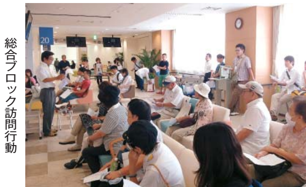
総合ブロック訪問行動

いましたが、今は事故死や自殺、病死、殺人など死ぬ原因も多様になり、枯れて死ぬのは難しくなっています。でも人間どのような死に方であれ必ずいつか死にます。火葬されておしまいと皆さんは思いませんか? いやそつではなく「のちの世」があるので