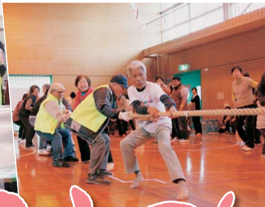
法人対抗綱引き大会も。5チーム参加、汗を流しました