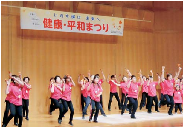
迫力の「よさこいソーラン」、40人近くで