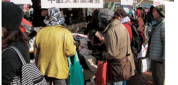
多くの参加者呼び声も大きく

8500名の参加で「健康平和まつり」が、好天のなか開催されました。 大阪の南部地域での健康づくり・まちづくりをすすめる大阪民医連・南ブロックが、実行委員会をつくり主催したもので、耳原総合病院建て替えに向け「心ひとつ」に飛躍することが目的です。