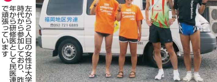
左から2人目の女性は大学 時代から参加しており、昨 年から研修医として民医連 で頑張っています