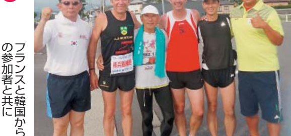
フランスと韓国から の参加者と共に