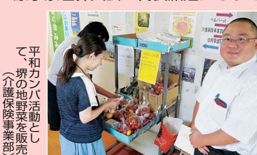
平和カンパ活動とし て、堺の地野菜を販売 (介護保険事業部)