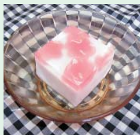
手づくりの桜かんてん

節を感じる食材を使用した日 々の食事はもちろんのこと、 年間の行事食や手作りおやつ も大変好評を頂いています。